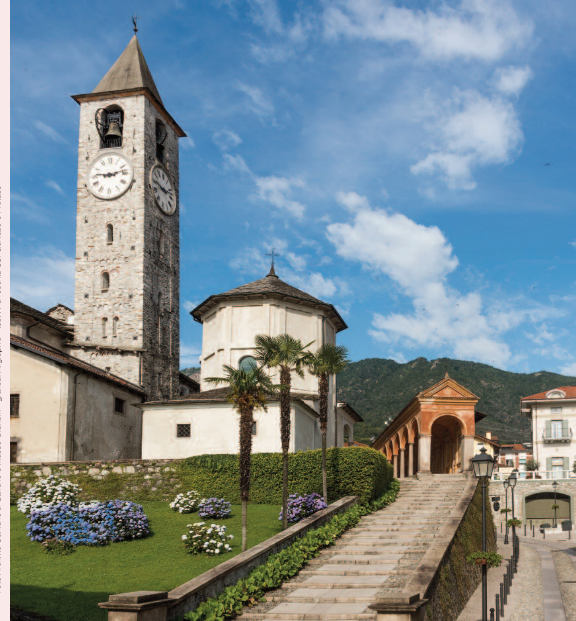
grafica: Aligraphis - testi: Parrocchia SS. Gervaso e Protaso